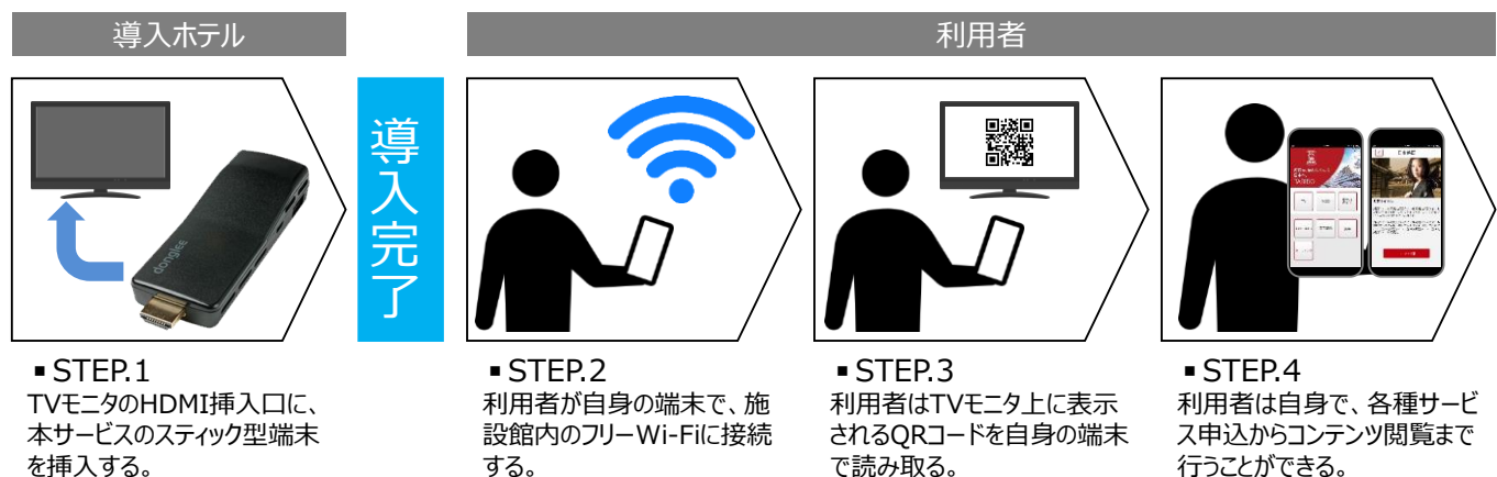
サービス導入フロー

ホテル内インフォメーションや周辺観光情報、クーポンの配信、施設やアクティビティ予約、エンタメコンテンツ(動画/雑誌/漫画など)の提供が、ホテルの客室テレビ上で簡単に実現。導入するホテルは、客室テレビのHDMI端子にスティック型端末を挿入するだけで、簡単にコンシェルジュサービスを提供することが可能です。※導入前に通信環境の確認が必要です。